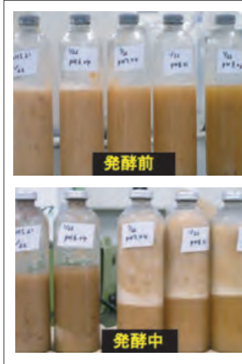
図3 水素発酵の状態

合成ゴムの再資源化の方法の一つとして、熱分解による化学原料化及び燃料化が検討されているが、合成ゴムの一部は塩素を含有しており、熱分解の際の塩酸生成による装置腐食や再生品への塩素の残留が問題となるため、脱塩素処理が必要である。本研究では、含塩素系ゴムの再資源化のための脱塩素技術の開発を目的とした基礎研究として、代表的な含塩素系ゴム クロロペンゴムの原料であるポリクロロペン(PCP)の脱塩素を主とした熱分解挙動の解析を、熱重量-質量分析装置(TG-MS:図2)を用いて行った。PCPの熱分解に伴う重量減少は四段階で起こり、第一及び第二段階では主に塩化水素が、第三及び第四段階では多環化合物を含む芳香族成分が生成することがわかった。