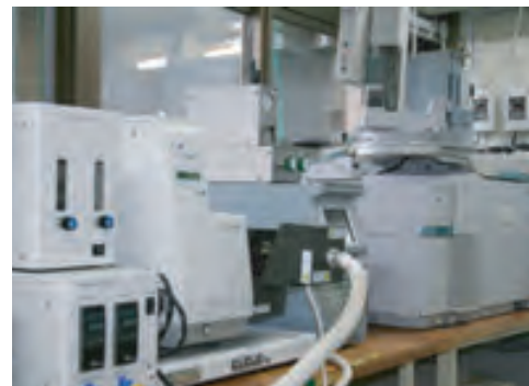
図2 熱重量—質量分析装置 (TG-MS)

本研究分野では、地球環境保全の重要な位置づけとなる資源・物質循環型の社会を実現するための技術開発として、廃プラスチック中の無機及び有機材料を化学的にリサイクルする研究を行っている。また、環境水中の無機及び有機の環境負荷物質の低減を目的とした環境保全・浄化技術の開発を行っている。さらには、より効率的なバイオマス資源・エネルギー循環を実現するため、有機性廃棄物の水素発酵による処理、木材の直接熱分解による選択的原燃料化を検討している。2006年の研究活動としては、以下のように概括される。